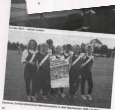
Deutsche Schüler-Sportlerinnen Meisterinnen im Badminton 1988 - 8. Platz