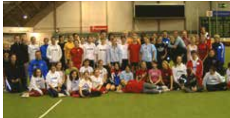
Int. Nachwuchstreffen in Finnland 2006