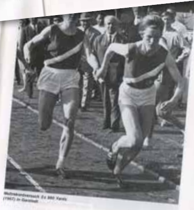
Waldlaufmeisterin, 2000 Meter (1987) in Garstedt